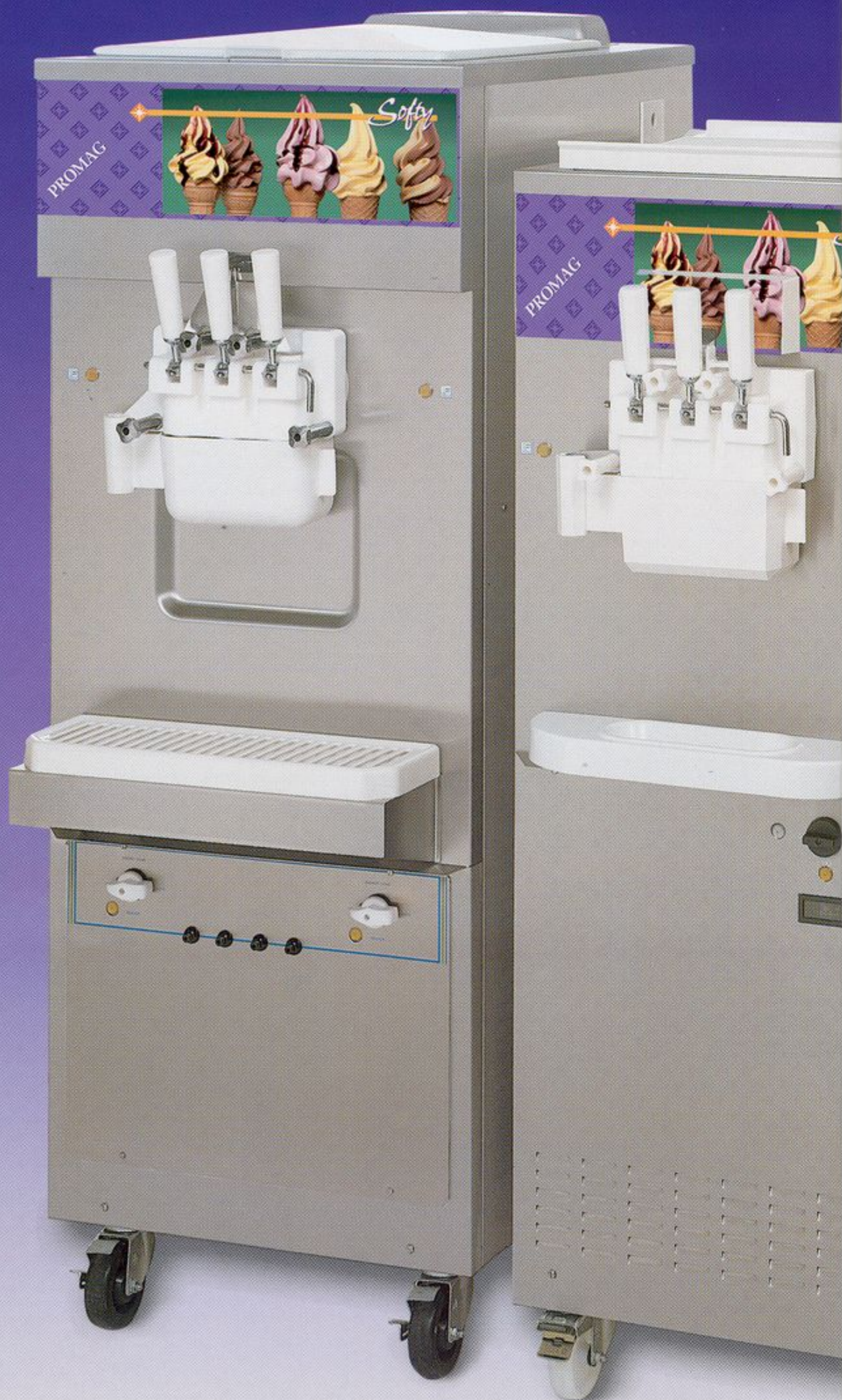
Softy 503 Super

La facilidad de instalación es uno de los requisitos determinantes en las máquinas Softy; en efecto, basta una mesa para las máquinas de banco, mientras que las máquinas sobre pavimento se colocan fácilmente gracias a sus ruedas y a su toma eléctrica.